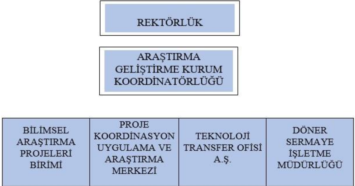
Şekil 1. Gazi Üniversitesi Araştırma Ekosistemi

Üniversitemiz araştırma üniversitesi vasfı kazanmış ulus ve uluslararası sıralamalarda önemli bir konuma sahiptir. Araştırma üniversitesi kimliğine uygun olarak araştırma faaliyetlerini, şekil 1’de verilen ekosistemde yürütmektedir.