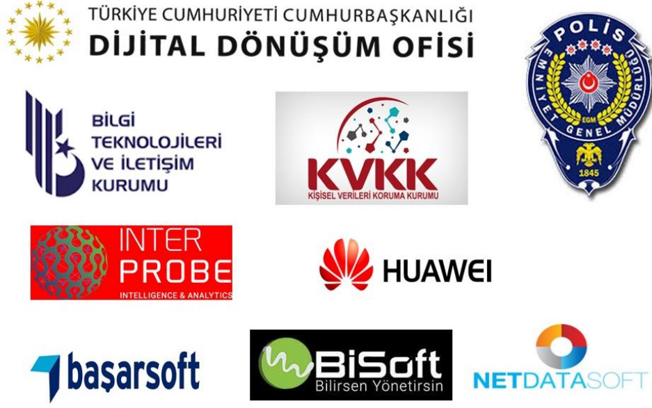
Şekil 2. Merkez dış paydaşları