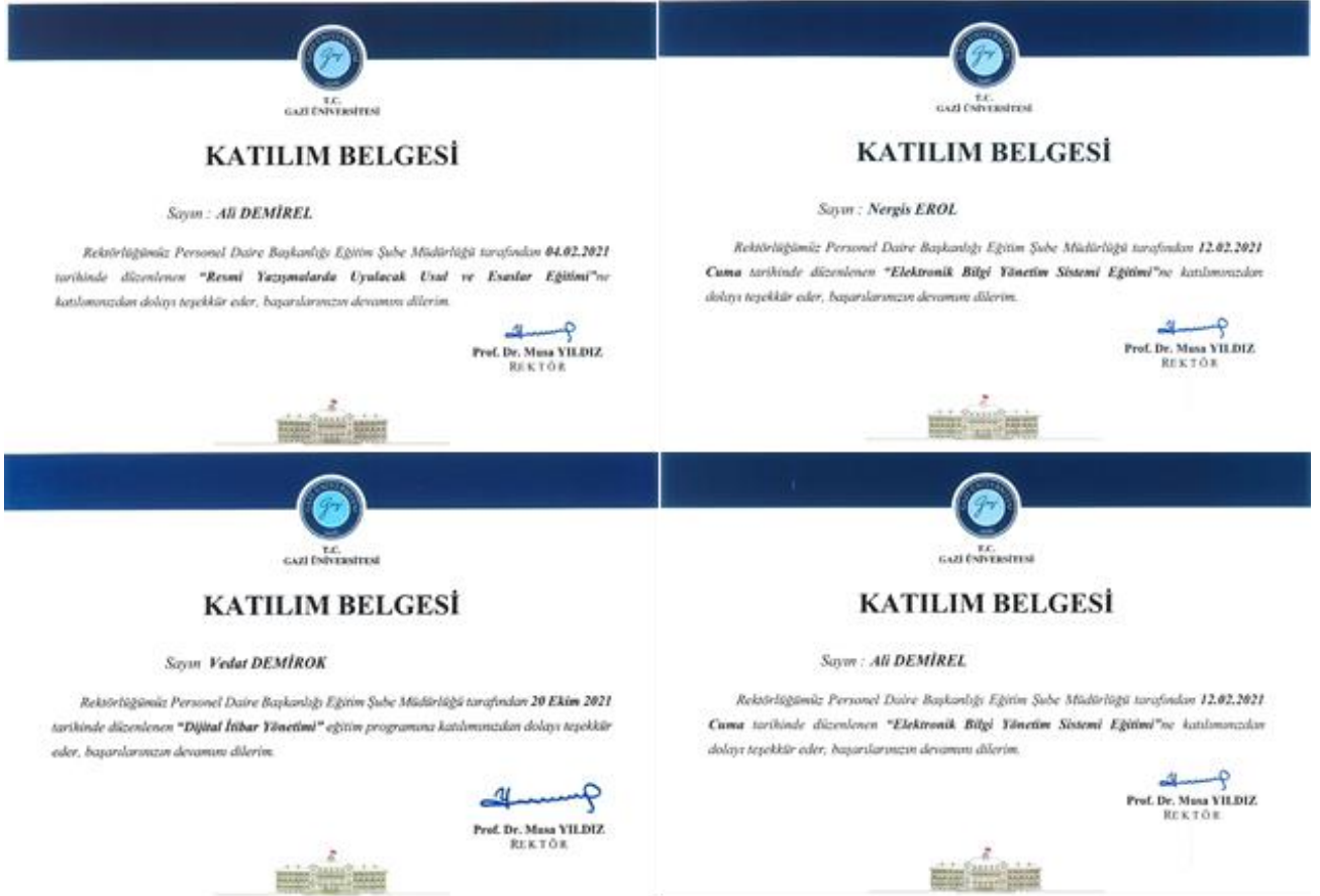
Şekil 9: Birim personelinin aldıkları eğitimlere ilişkin sertifika örnekleri