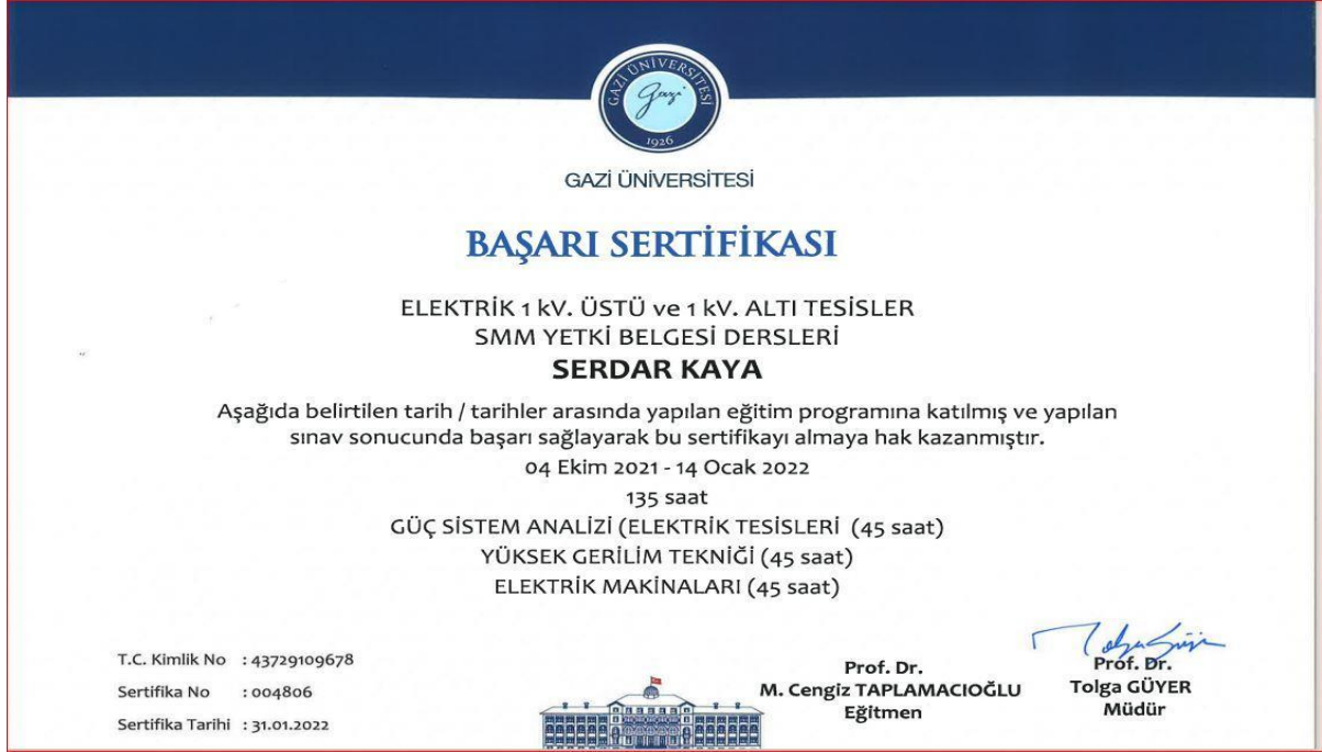
Şekil 5: Katılım Sertifikası örneği