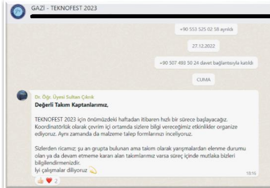
Gazi TEKNOFEST 2023 Resmi Whatsapp Grubu