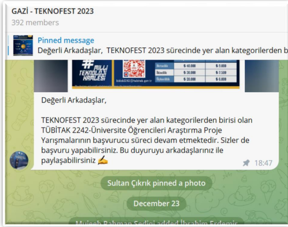
Gazi TEKNOFEST 2023 Resmi Telegram Grubu