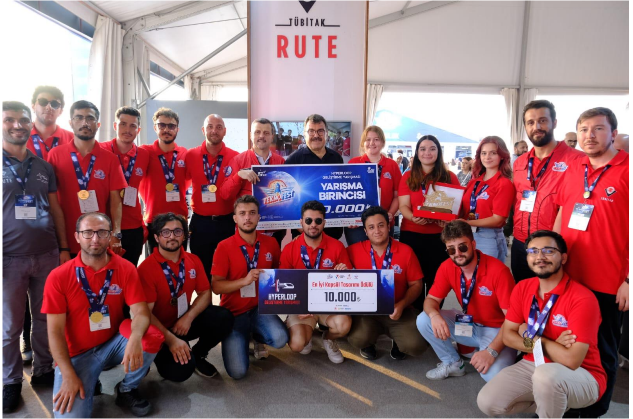
TEKNOFEST 2022 Hyperloop Geliştirme Yarışması Birincisi TURKUAZ Takımı