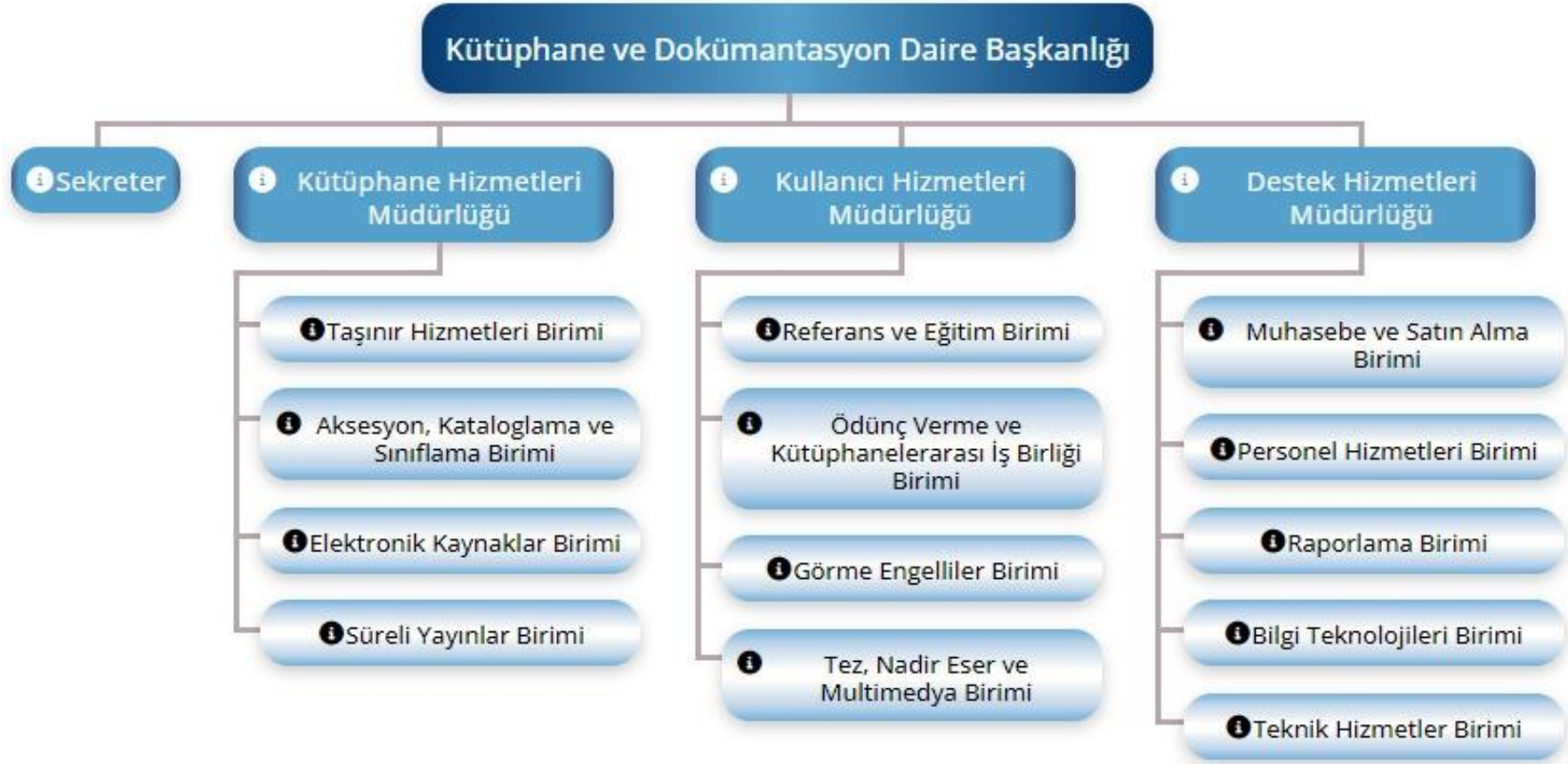
Şekil 1 Organizasyon Şeması