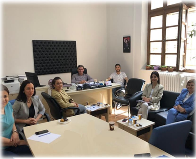
İç Denetim Stratejik Plan Ofis Toplantısı

Bilimsel Araştırma Projeleri Koordinasyon Birimi 2024-2028 Dönemi Stratejik Plan hazırlık süreci altı aşamalı olarak yürütülmüştür.