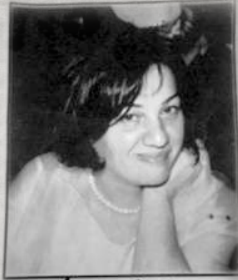
İclal Çakıcı 1956