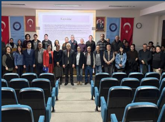
“İlk Yardım Farkındalığı”