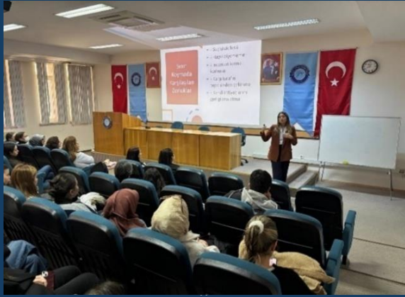
“Sınırlarımızı Koruyarak Anlamak ve Anlaşılmak”