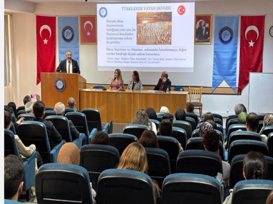
“Türklerde Vatan Sevgisi”