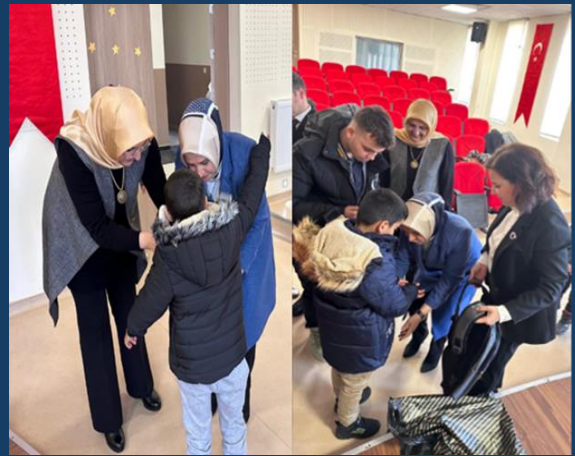
“Minik Yavrularımız için Bot, Mont, Çanta Kampanyası”