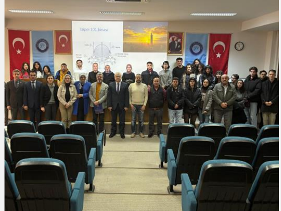
“Deprem Gerçeği ve Depreme Dayanıklı Yapılar”