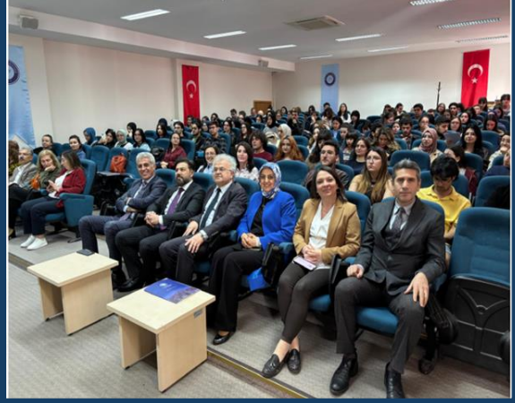
“Kendine İyi Bak”