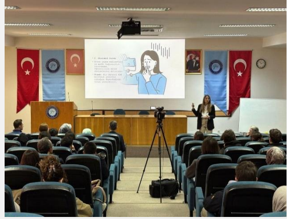
“Gelecek Kaygısı ve Başa Çıkma Yolları”