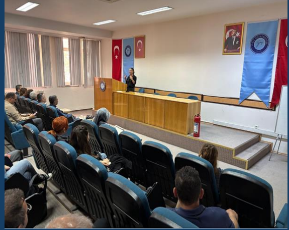
“Yangın Eğitimi ve Tatbikatı”