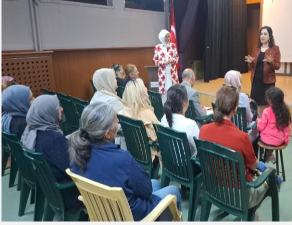
“Fen Fakültesi Mahalleleri ile El Ele Güzel Yarınlar”