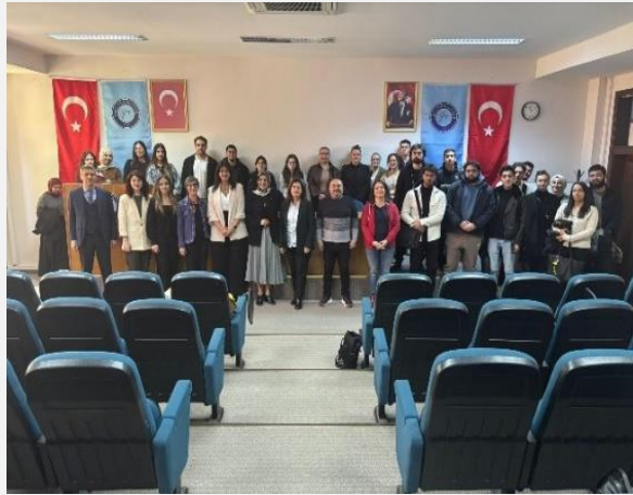
“Fikri Haklar ve Yönetimi”