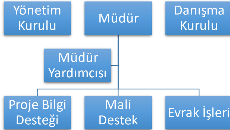
Şekil 1. Organizasyon şeması

süreçlerin takibi ve ödeme işlerinin yürütülmesinde 2 personel aktif görev almaktadır. Diğer personeller ise proje başvuru ve mevzuat süreçlerinin Üniversitemiz süreçlerinde başvuru ve proje süreçleri hakkında destek hizmeti sunmaktadır.