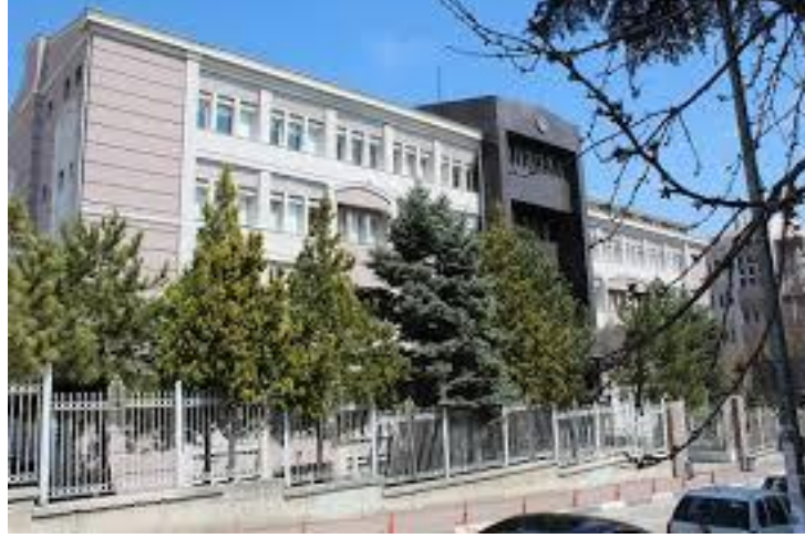
Diş Hekimliği Fakültesi